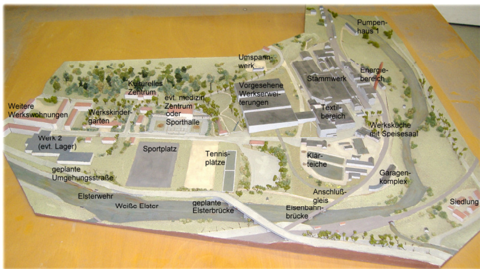
Beschriftetes Werksmodell, das genaue Herstellungsjahr ist leider unbekannt

Der Werkskindergarten und das Ambulatorium waren damals ebenfalls an ihren heutigen Standorten geplant. Über den vorgesehenen Werksenerweiterungen ist höchstwahrscheinlich ein Umspannwerk dargestellt, das aber so in seiner Form erst 1958 gebaut wurde. An ein Kulturhaus und eine Sporthalle wurde dabei wahrscheinlich ebenso schon gedacht.